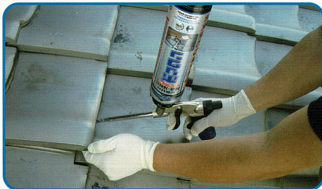
●粘土瓦・セメント瓦に