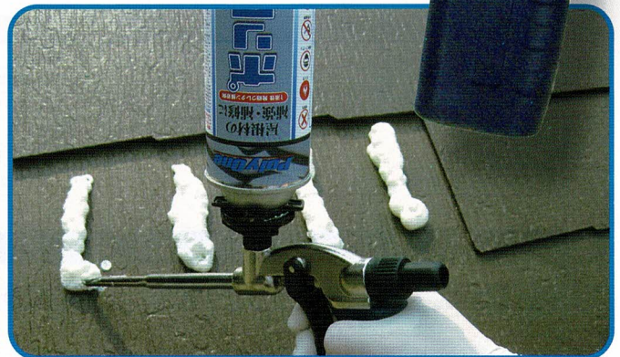
●薄型スレート屋根材に